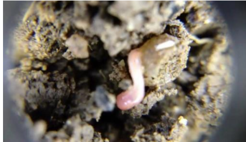
Gusano saliendo del huevo en el espacio poroso de un suelo con buen conglomerado.

Cuando estos dos principios se aplican correctamente, los suelos no solo mantienen la SOM, sino que además pueden generar SOM y mejorar el ciclado de nutrientes y el crecimiento general de la planta (cultivo o forraje).