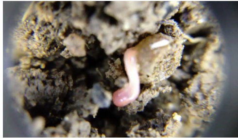
Pom tshwm sim tej cua nab nteq qe rau hauv tej chaw uas muaj av zoo.

Kev ua rau tej cag qoob loo muaj sia nyob rau hauv av mas thiaj li yuav ua tau peb lub hauv paus ntsiab lus no, thiab tuaj yeem tau li no los ntawm kev cog qoob loo hloov pauv mus los, tej qoob loo npog av, thiab/los sis los ntawm tej nyom uas ib txwm muaj (nyom uas ib txwm xeeb txawm los sis los sis nyom tshav tsiaj noj). Kev cog tej qoob loo ntau yam mus los rau hauv lub xyoo los sis ntau lub xyoo mas thiaj li yuav rhuav tshem tej kab mob/voj voog kab noj. Ua kom muaj ntau yam tsiaj me me muaj sia nyob hauv av thiab ua kom muaj tej cag muaj sia nyob hauv av thiaj li yuav pab ua rau txheej av hauv qab av ua hauj lwm tau zoo thiab ua rau muaj tej ntab tej muv coob zuj zus tuaj. Thaum siv ob lub hauv paus ntsiab us no tau raug zoo lawm, ces tsis yog tej av yuav muaj SOM xwb thiab sis yuav tsim SOM thiab ua rau muaj chiv thiab ua rau qoob loo loj hlob (qoob loo los sis zaub nyuj).